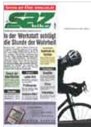
Anzeigen in der SAZ